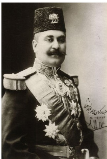
تصویری از صمدخان ممتازالسلطنه

۳- اعلان رسمی در باب قدغن بودن استعمال گلوله‌هایی که در بدن انسان به آسانی متلاشی و پهن می‌شود و کذالک گلوله‌هایی که لفافه اش ضخیم است... این قرارنامه‌ها و اعلانات رسمیه را بعد از غوررسی و تحقیق و تدقیق، قبول و ممضی داشتیم. چنان که به موجب این سطور آنها را تماماً ممضی و مجری می‌دانم و از طرف خودمان و ولیعهد و خلف خودمان قول می‌دهم که تمام فصول و مضامین این قرارنامه‌ها و اعلانات رسمیه بدون تخلف مجری خواهد شود به موجب این قبولی به دستخط خودمان این نوشته را امضا نموده و بنویسیم به مهر دولتی ممهور شود.